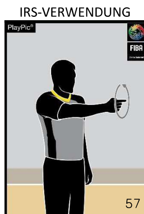
Kreisbewegung der Hand (Zeigefinger waagrecht)