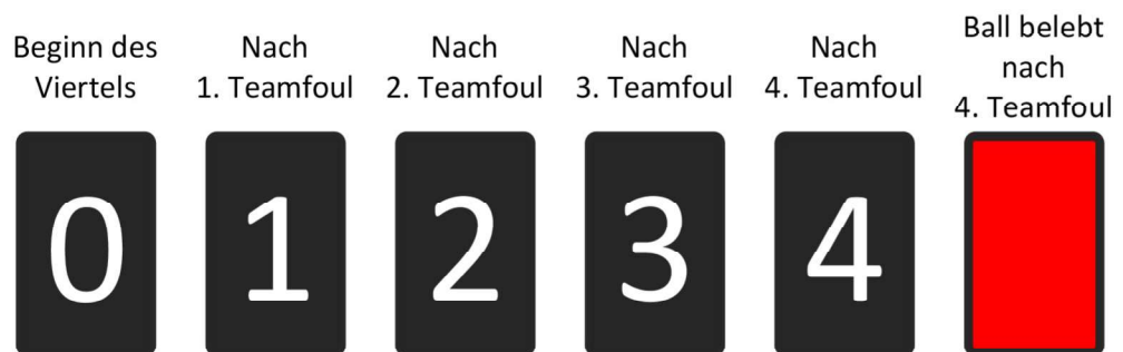
Anzeiger für die Anzahl der Mannschaftsfouls (Ausführungsbeispiel für elektronische Anzeiger)

Neu: Hat eine Mannschaft in einem Viertel ihr 4. Mannschaftsfoul begangen, muss der Anzeiger ohne Ziffernanzeige und ganz in Rot dann aufgestellt werden, sobald der Ball wieder belebt wird: