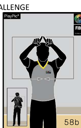
Schiedsrichter bestätigt die beantragte Challenge